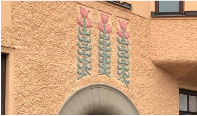
5. Vackert port nära "port" till vatten Bastugatan 53