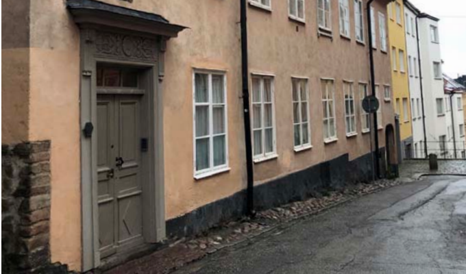
9. Högsta läget som kanske passar präst Maria Prästgårdsgata 5