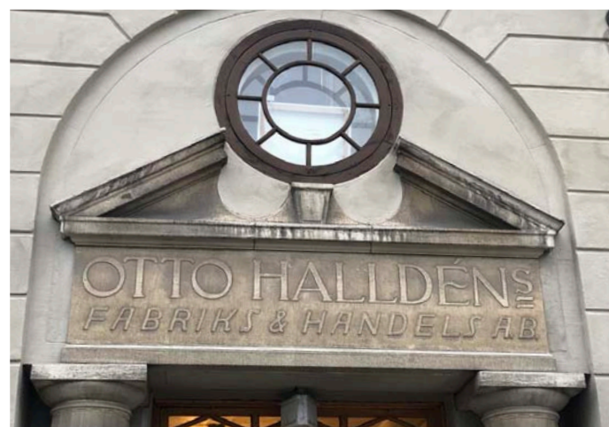
3. Konstfull port i konstfullt område Hornsgatan 36