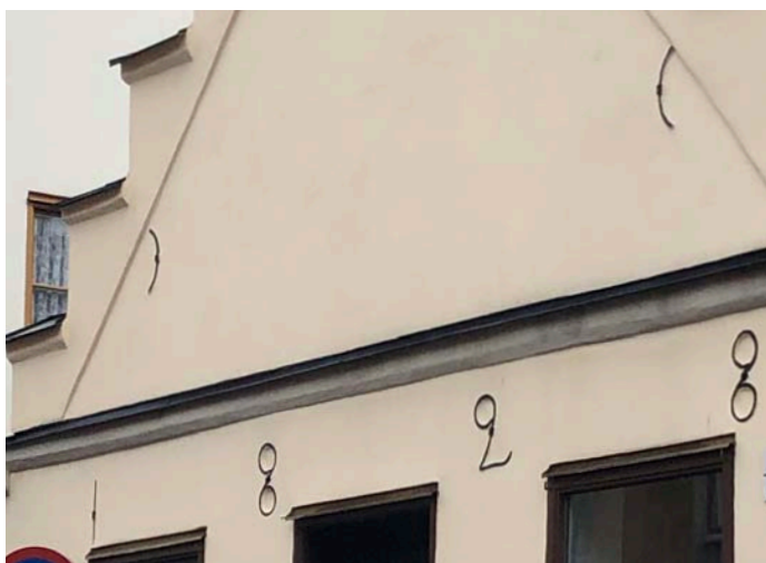
2. En gång högtliggande snusfabrik Bellmansgatan 5