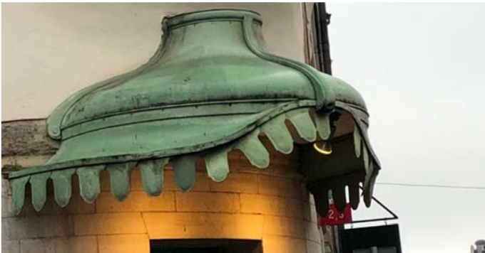
7. Pillerplats blev inredningsplats Hornsgatan29/Bellmansgatan 20