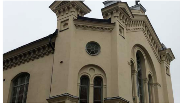
6. Andlig hörna Brännkyrkagatan25/Blecktornsgränd13(AB)