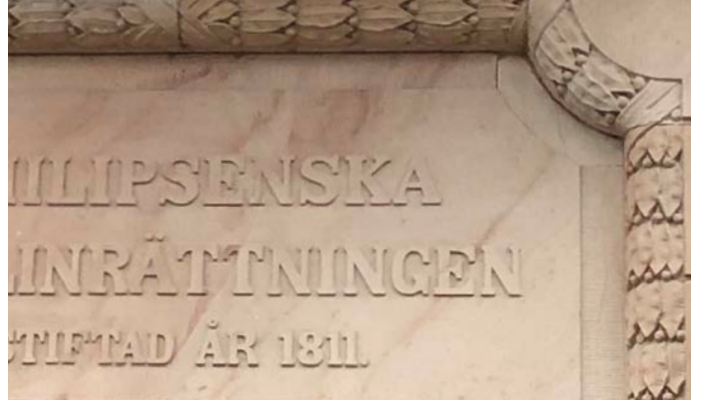
10. Gammal inrättning nära omdöpt plats Mariatorget 1C