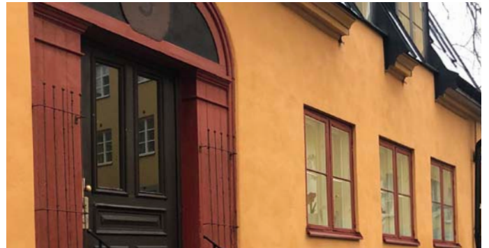
8. Ingen mjölnarstuga men gammal fiskhandlarstuga Kvarngatan 5