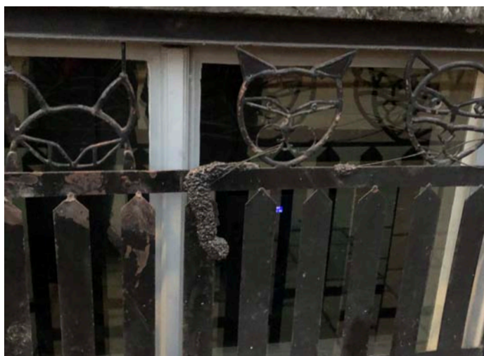
1. Katter i kattkvarter Bastugatan 25