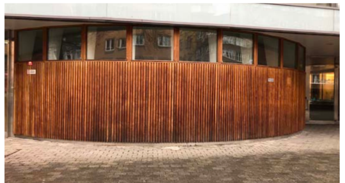
12. Träinramning av myndigt hus Torkel Knutssonsgatan 20