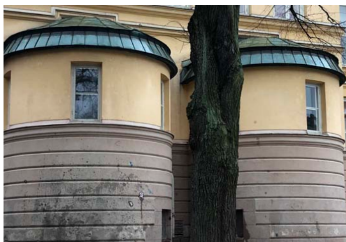
4. Kunskapens högberg? Swedenborgsgatan/Högbergsgatan (56) Björngårdsgatan (10) eller Björngårdsskolan