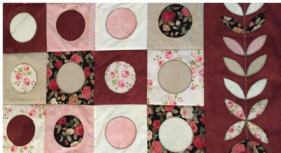
Lappteknik av Birgitta Horn