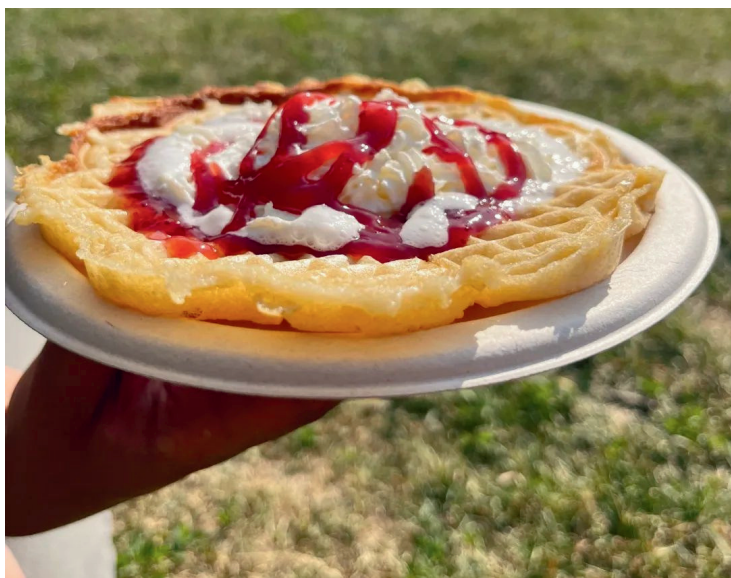
Våfflor från Lilla Södergårdens servering i Björns trdgård.

att skapa en mångfaldsgrupp som ska fokusera på att öka mångfalden bland deltagarna genom att identifiera hinder för deltagande och skapa evenemang som attraherar deltagare med olika bakgrunder. Inom miljöområdet implementeras en miljöpolicy med fokus på återbruk och minskad konsumtion av nya resurser samt kommunikation och utförande av hållbart arbete. Styrelsen har öppnat upp för att adjungera ungdomsrepresentanter.