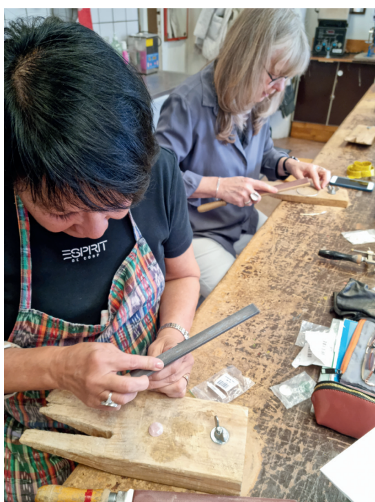
Kurs i silversmide.

Södergården samarbetar med andra föreningar och organisationer genom att låna eller hyra ut lokaler. Det är fristående grupper vars medlemmar i många fall också är medlemmar i Föreningen Södergården. Även här varierar storlek, mål och innehåll bland och inom grupperna. Omfattningen av Södergårdens egen verksamhet och utbudet av lediga lokaler kommer även i fortsättningen att styra antalet grupper.