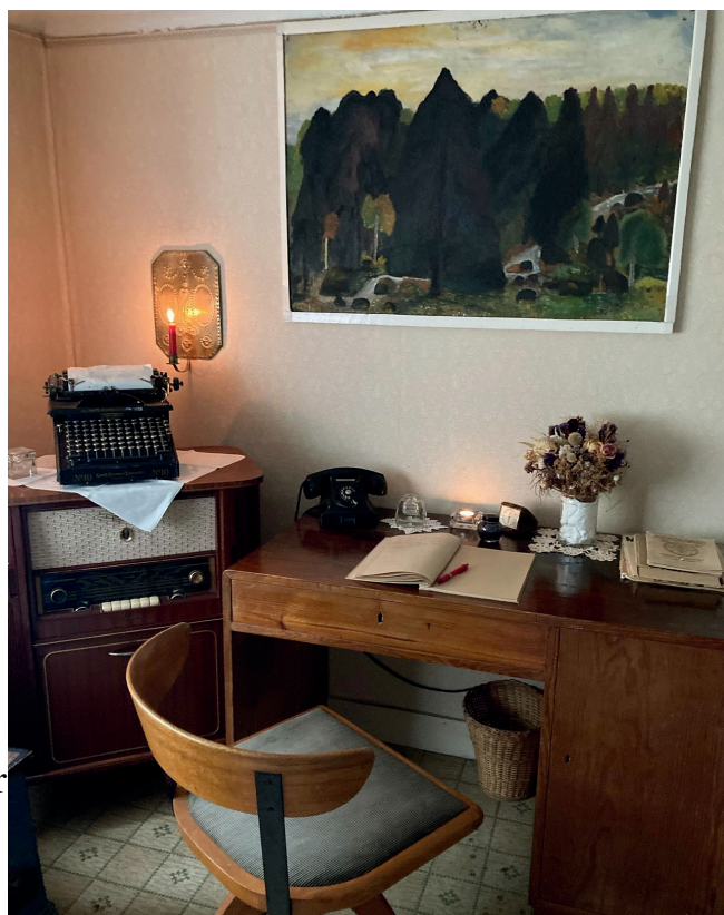
Resa till Moa Martinssons torp och Ösmo kyrka.

En resa med Södergården kan ha flera syften. Det kan vara en förlängning av det man läst om i en studiecirkel eller för att lära känna nya människor. Det viktigaste med resorna är nog ändå möjligheten att under en längre sammanhängande tid tillsammans få uppleva något roligt, spännande och intressant. Upplevelser som i gruppen skapar sammanhållning och vänskap. Många av deltagarna blir också intresserade av Södergårdens övriga verksamhet och deltar i dem; inte sällan som frivilligarbetare. Resorna har en stor betydelse för deltagarna och för Södergårdens framtida verksamhet, varför de bör fortsätta och nya resmål stakas ut i samråd med tidigare deltagare. Utöver resor planeras även kortare utflykter och besök på museer och utställningar.