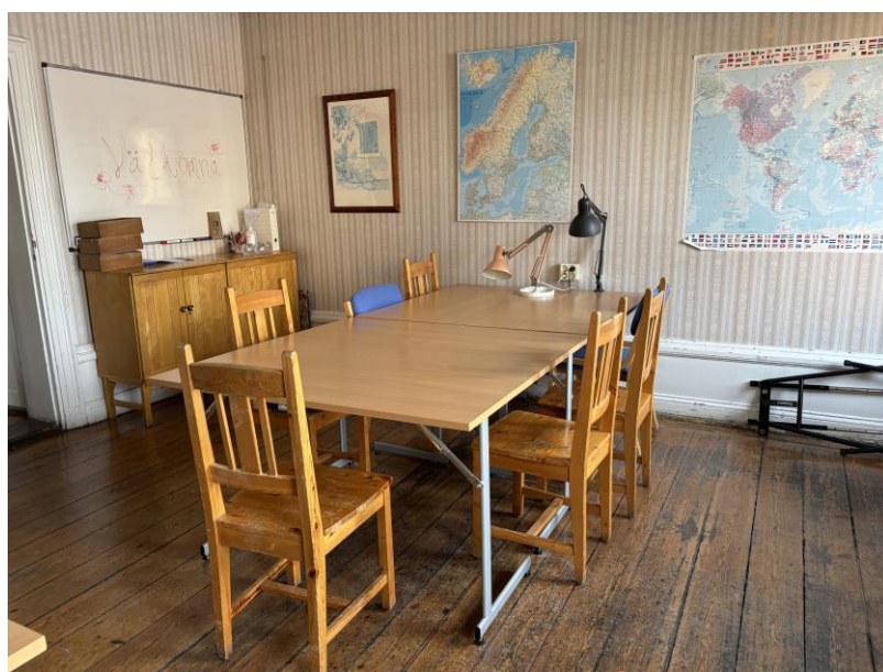
Bilaga 6. Klassrummet, bordsplaceringen.