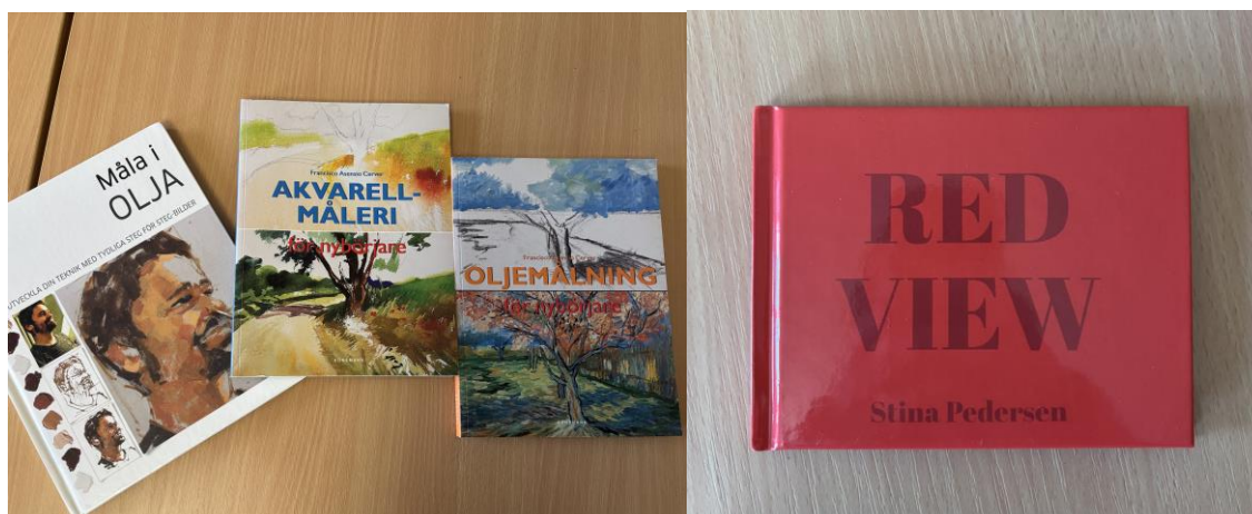
Bilaga 4. Böcker för teknik samt min egen bok som stöd/exempel.