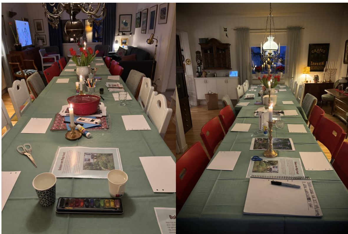
Bilaga 3. Bilder från test-workshoppen.